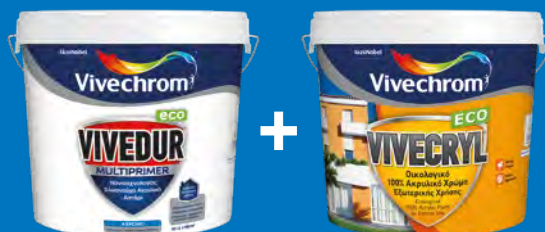
VIVEDUR MULTIPRIMER ECO + VIVECRYL ECO