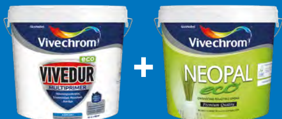
VIVEDUR MULTIPRIMER ECO + NEOPAL ECO